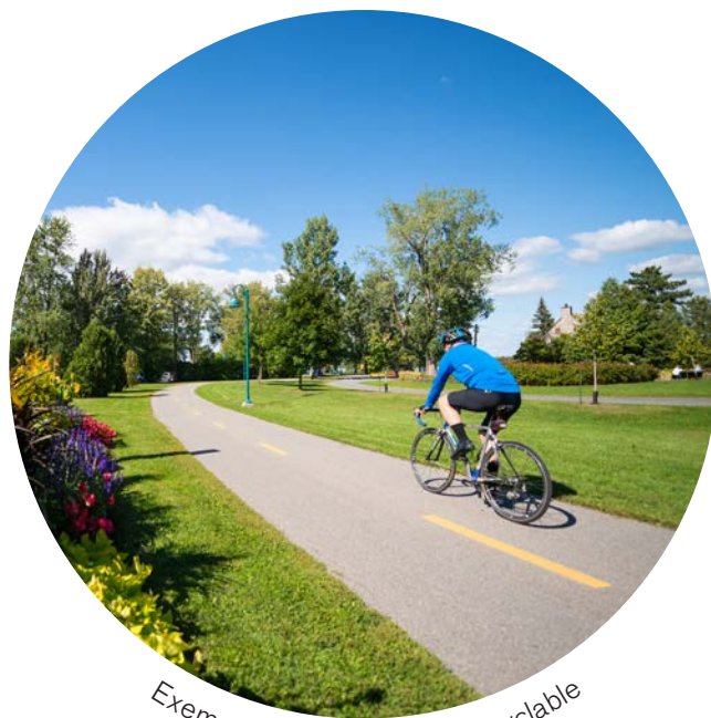
Exemple: bonifier le réseau cyclable

Mettre de l'avant les attributs récréatifs et utilitaires des réseaux cyclable et piétonnier aussi bien par leur promotion que par leur consolidation et leur mise aux normes.