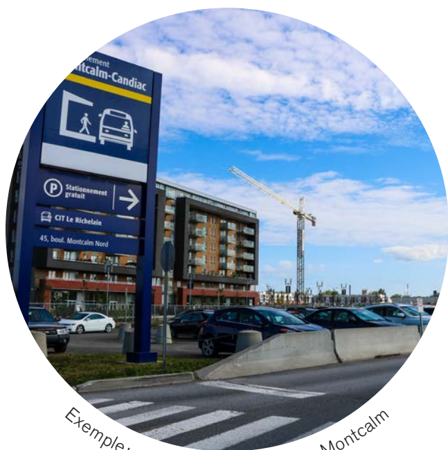
Exemple: réaménager le Terminus Montcalm

Proposer une offre bonifiée en transport alternatif et en commun afin de réduire l'utilisation de "l'auto solo".