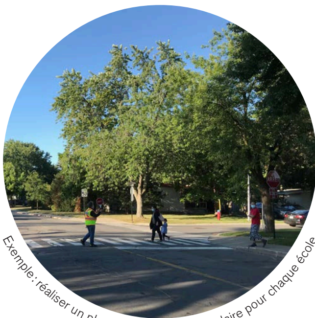
Exemple: réaliser un plan de déplacement scolaire pour chaque école

Assurer des zones scolaires sécuritaires et propices à des déplacements actifs.