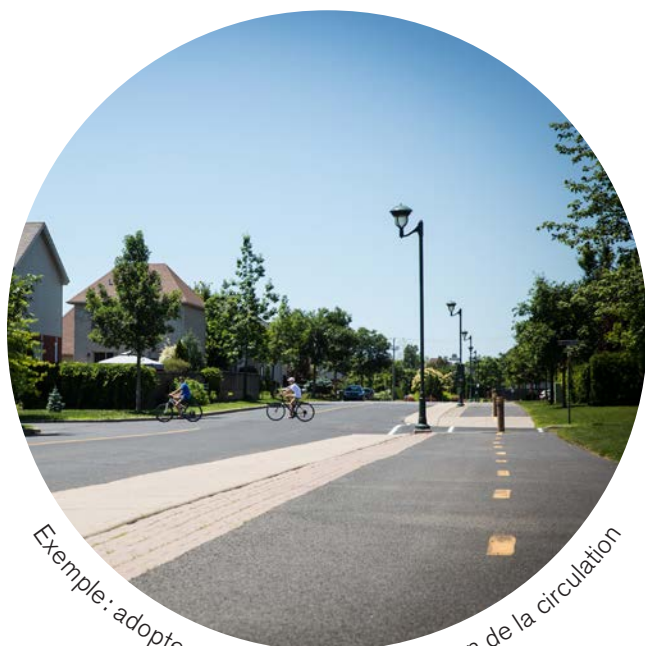
Exemple: adopter un programme de gestion de la circulation